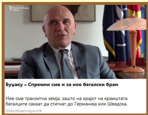
Буцаку – Спремни сме и за нов бегалски бран

Ние сме транзитна земја, зашто на крајот на краиштата бегалците сакаат да стигнат до Германија или Шведска. slobodnaevropa.mk